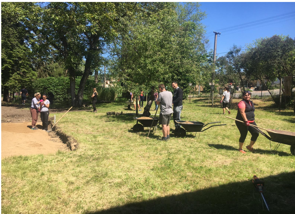
Učitelská brigáda na zahradě školy – příprava místa na budoucí altán.