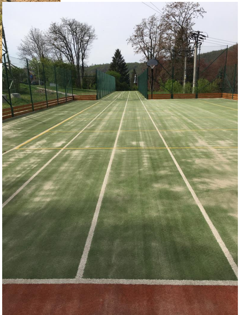
Vyčištěný povrch školního hřiště.